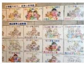
保育園と連携した マナー啓発ポスター