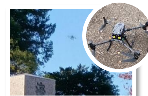
ドローン撮影による デジタルマップの活用