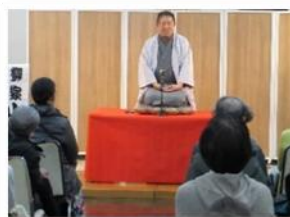
霊園に眠る小泉八雲に ちなんだ怪談斬