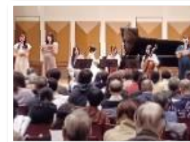
区部4霊園 開園 150周年記念イベント