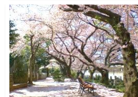
染井霊園のソメイヨシノ