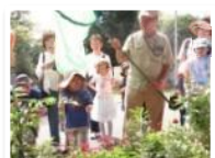
自然観察プログラム