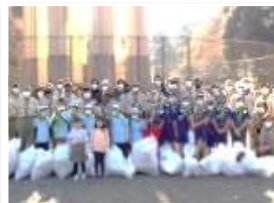
ボーイスカウトとの清掃活動