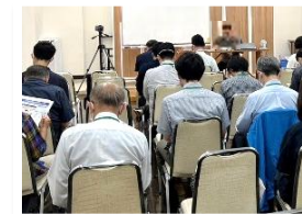
霊園業務に関する 研修の実施